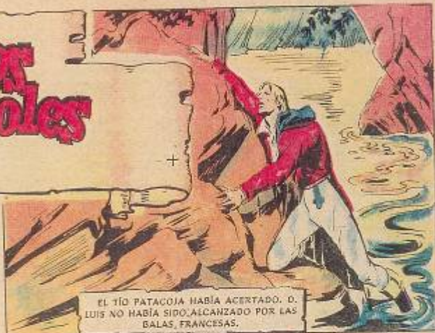
EL TÍO PATACOJA HABÍA ACERTADO. D. LUIS NO HABÍA SIDO ALCANZADO POR LAS BALAS FRANCESAS.