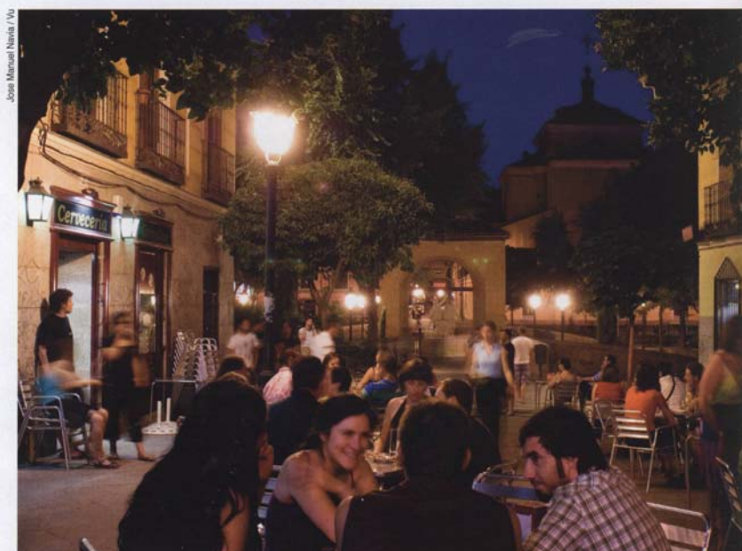
Jose Manuel Nieto / VU

Disséminées à travers le vieux Madrid, les traces ne manquent pas de ces événements dont on célébrera l'an prochain le bicentenaire. Au cœur du Prado, coïncé au cœur du vieux Madrid entre la grande avenue arborée du paseo et