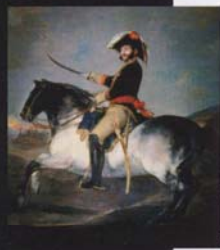
Portrait de Palafox, par Goya. Le général s'illustra lors du siège de Saragosse.

L'Angleterre intouchable, Napoléon consolide son blocus des côtes européennes.