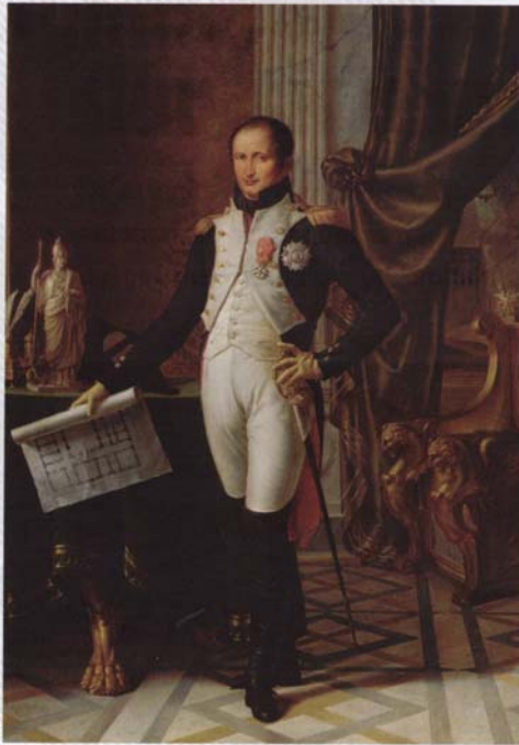
Joseph Bonaparte, le «roi intrus», règne sur l'Espagne de 1808 à 1813. Huile sur toile de Jean-Baptiste Joseph Wicar, 1808. Musée de Versailles.

En plaçant son frère Joseph sur le trône, Napoléon déclenche une insurrection et la première guérilla de l'histoire.